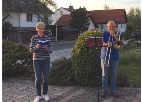
Unten: Naumburger Straße/Königstraße