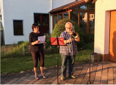
Oben: Treffpunkt Buchenstraße

Balhorn erfreut und ermutigt haben! Leider sind nicht alle Mitwirkende auf den Bildern zu sehen.