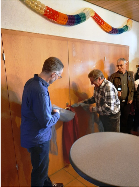
Da ging noch etwas: Eröffnung Gemeindesaal am 1. März in Bildern