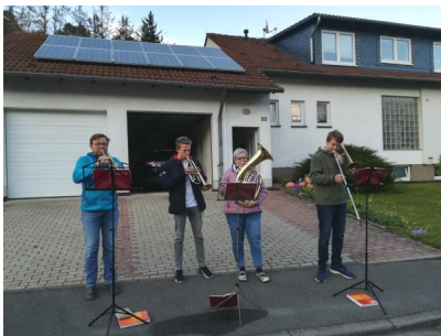
Musikanten vom Distelberg